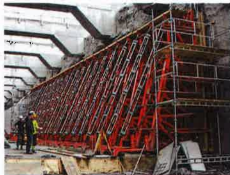
Abstützung von einhäuptigen Wänden bis 13,50 m.