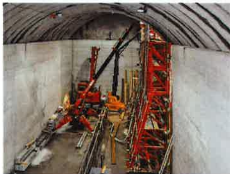
Aufnahme von großen Lasten bei geringen Platzverhältnissen.

Die Stützböcke und -konsolen kommen vorrangig zum Einsatz, wenn gegen eine bestehende Struktur wie Wand oder Fels gearbeitet und daher nur einhäuptig geschalt wird. Der Frischbetondruck wird über die Schalung in den Stützbock und von dort in das Fundament abgeleitet.