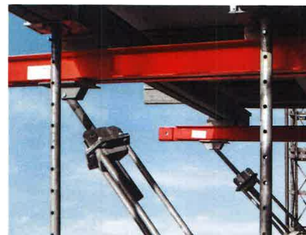
Tripex als Unterstützung für Plattformen, bei auskragenden Decken und schwebenden Balkonen.